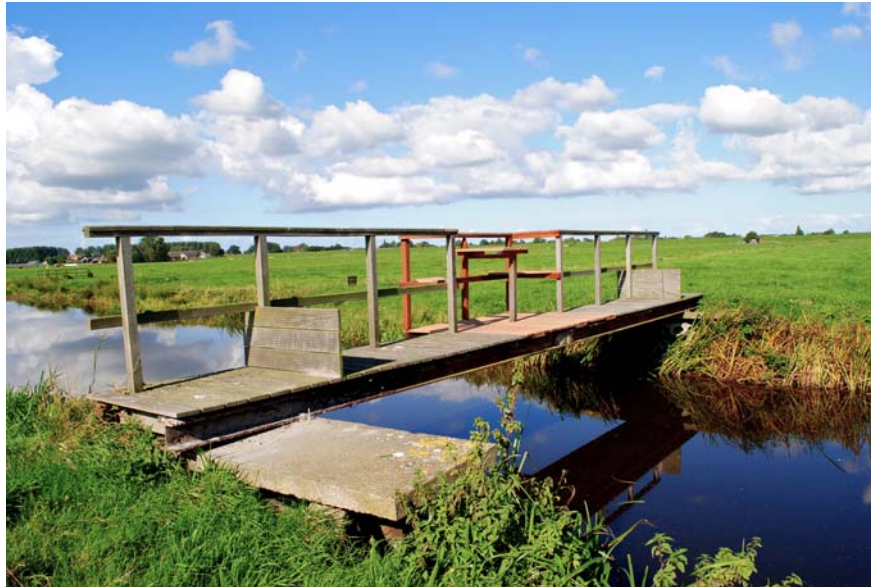
Brug met nieuw zitje bij de Geerpolder